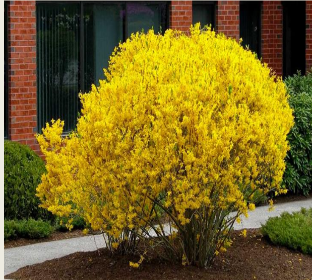
Форзиція європейська ( Forsythia europaea )