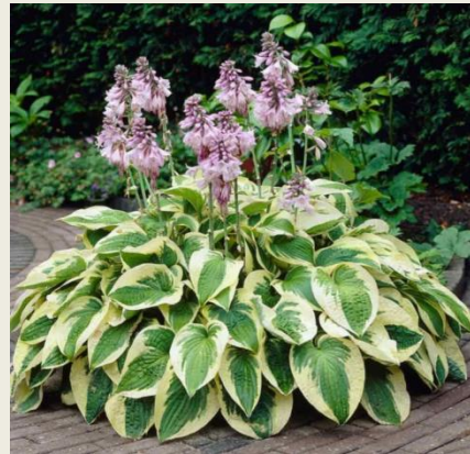
Хоста гібридна ( Hosta hybrida )