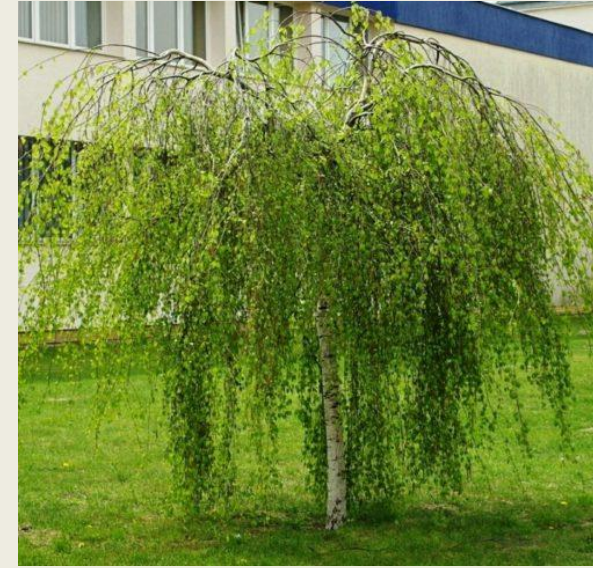
Береза плакуча ( Betula pendula )