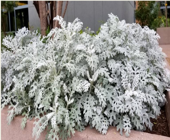
Цинерарія ( Cineraria )