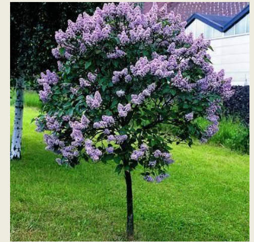
Бузок звичайний ( Syringa vulgaris )