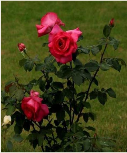
Троянда гібридна ( Rosa hybrid )