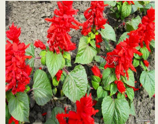
Сальвія червона ( Salvia coccinea )