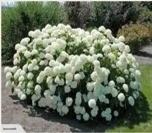
Гортензія деревовидна ( Hydrangea arborescens )