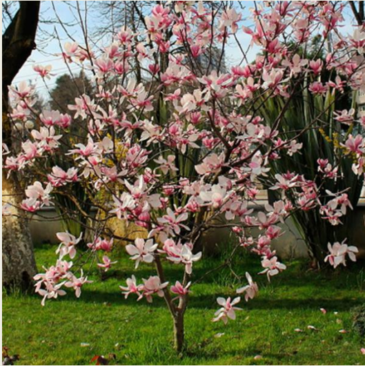
Магнолія кобус ( Magnolia kobus )