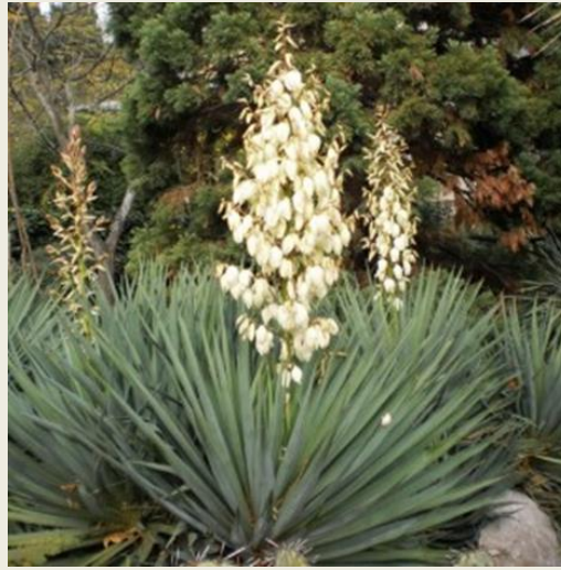
Юка золотиста ( Yucca gloriosa )