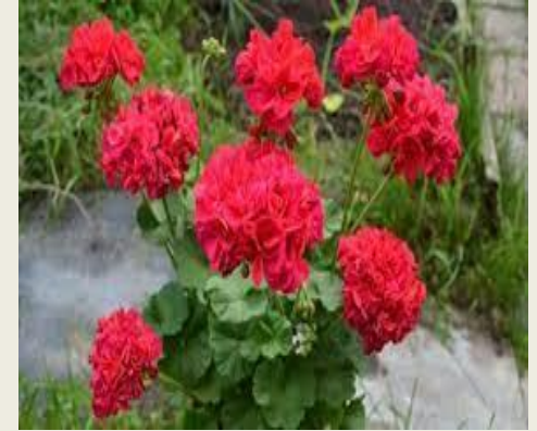
пеларгонія садова ( Pelargonium hortoru )